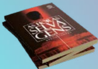
"AS HORAS SELVAGENS" Segundo livro do autor Breno Torres

“Se uma dessas pessoas que estão fazendo literatura especulativa não é uma pessoa LGBTQIA+, muito provavelmente você não vai ter protagonismo LGBTQIA+ nessas histórias”.